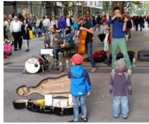
Die Gruppe Stilbruch, hier beim Konzert auf der Prager Straße, feiert morgen im Alten Schlachthof ihr zehnjähriges Jubiläum.