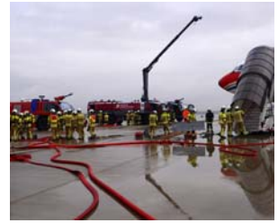
Regelmäßig wird am Flughafen Dresden der Notfall geprobt.

Diese schwarz-roten Fässer gehen eigentlich in die ganze Welt, gefüllt mit Drahtseilsmierstoffen oder Korrosionsschutzmitteln von Elaskon aus Dresden. Jetzt verbindet das Unternehmen ein besonderes Engagement mit Südafrika. Es stattet die Trommler der „Blechlawine“ für ihre Performance bei der HOPE-Gala mit neuen Metallfässern aus. Die Benefiz-Gala findet am 31. Oktober zum 10. Mal statt und sammelt Geld zugunsten des HIV-Projektes HOPE Cape Town in Südafrika. Wie im Vorjahr ist die „Blechlawine“ dabei und liefert vor dem Schauspielhaus ab 18 Uhr einen unüberhörbaren Auftakt. Seit ihrer Gründung vor 15 Jahren nutzt die „Blechlawine“ die auffälligen 200-Liter-Fässer von Elaskon. Für ihren Auftritt bei der HOPE-Gala haben die Trommler Nachschub an Instrumenten geordert, denn der Verschleiß beträgt 15 Fässer pro Jahr.